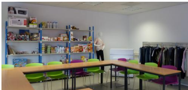
Notre magasin pédagogique